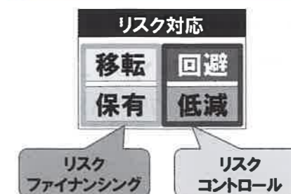
図表 リスク対応のバリエーション

豆知識 「サイバー攻撃」とは？ コンピュータシステムなどを利用して、標的のコンピュータやネットワークに不正に侵入してデータの詐取や破壊、改ざんなどを行ったり、システムを機能不全に陥らせたりする行為。