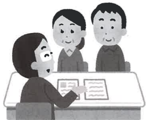
納得いくまで相談しよう!