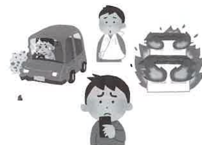
事故が発生したらすぐに連絡することが大切です。